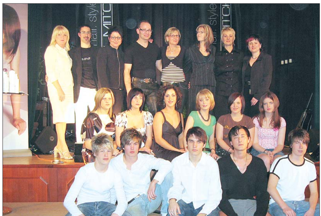
Das Mode-Team Wolfenbüttel, hintere Reihe, und die frisch gestylten Modelle präsentieren sich auf der Bühne im Oelper Waldhaus.

Wolfenbüttel • Okerstraße 2 (um die Ecke) Telefon 0 53 31 / 54 05 Mo. - Do. 9 - 18 Uhr, Fr. 9 - 20 Uhr, Sa. 8 - 12 Uhr www.connyshaarstudio.eu